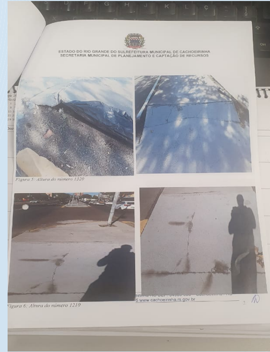
Figura 3: Altura do número 1320

Av Flores da Cunha nº 2209 – Centro – Cachoeirinha-RS CEP: 94950-000 – Cachoeirinha / RS – Fone / Fax: (51) 3471-2615 www.cachoeirinha.rs.gov.br